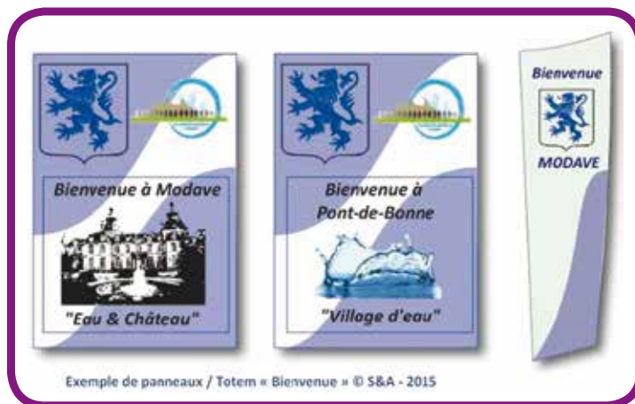
Suggestion de panneaux et totems d'identification

Une réflexion devra être menée avec les Modaviens afin notamment de déterminer un élément identitaire propre à chaque village (un thème, un lieu, un bâtiment, une richesse naturelle, un slogan, etc.) ainsi qu'un élément fédérateur pour l'ensemble de la commune (logo, charte graphique, etc.). N'hésitez pas à nous communiquer vos idées !