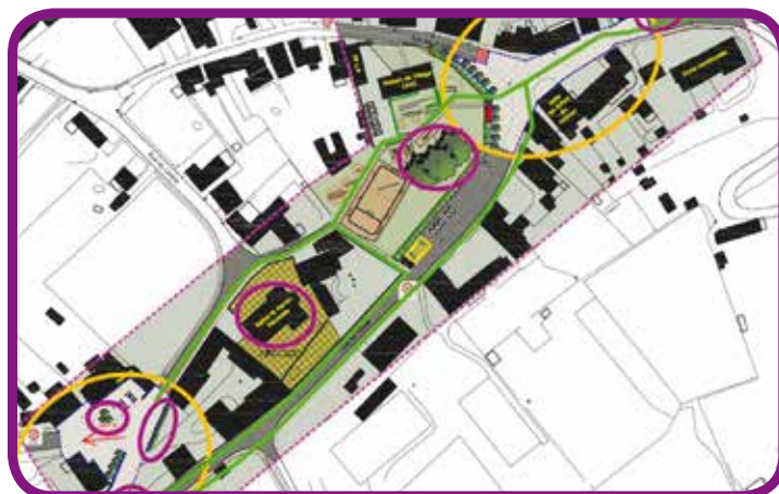
Le projet d'aménagement du cœur du village de Modave